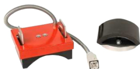
TS Mono acessório para prensa base chapéus