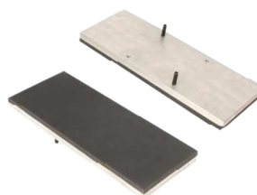
TS Mono acessório para prensa base 15 x 38 cm